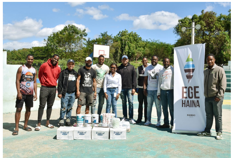
Entrega de materiales para el remozamiento de la Cancha Pajarito, en Yaguaje, San Cristóbal.

Por último y no menos importante, en Yaguaje, San Cristóbal, contribuyó con la donación de materiales a la Liga de Baloncesto para el remozamiento de la Cancha Pajarito y entregó una nueva cancha en la comunidad de Arroyo Mamey.