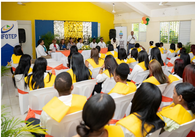
Acto de entrega de certificados a comunitarios de la región Sur.

A través de la formación técnica, EGE Haina contribuye al crecimiento integral de las comunidades.