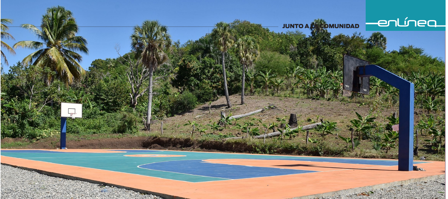
La recién inaugurada cancha de Arroyo Mamey, San Cristóbal.