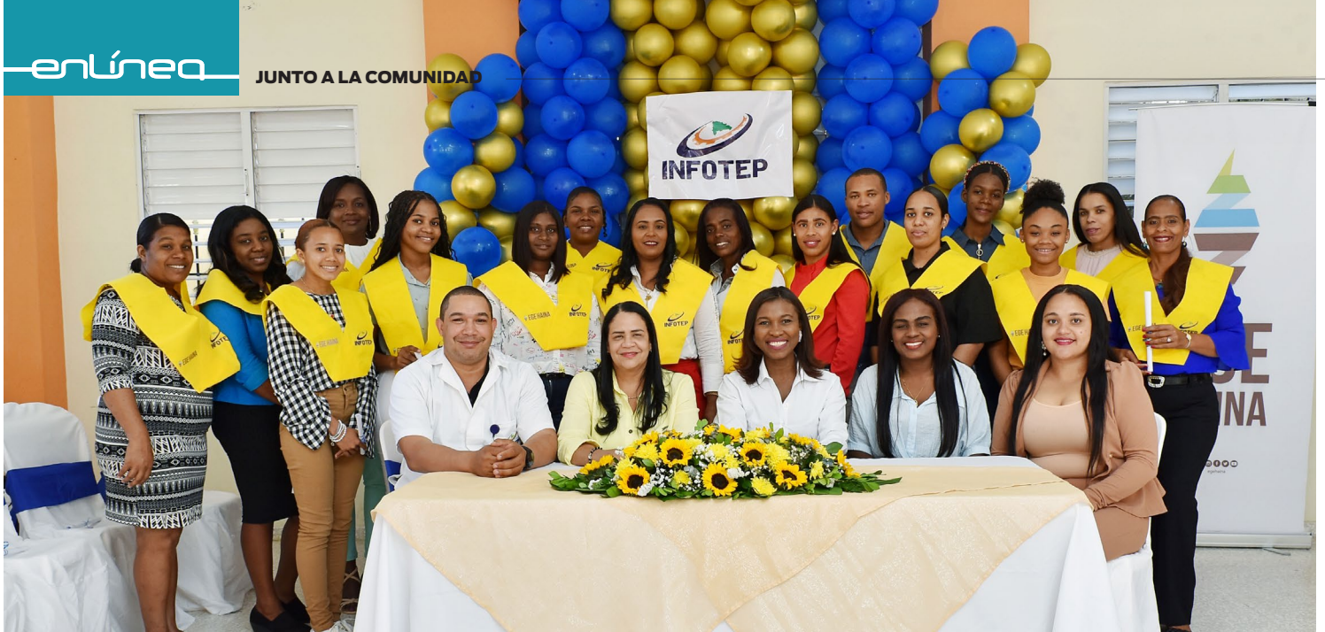
Graduandos del curso de Paquete de Oficina, pertenecientes a la comunidad de Yaguaté, San Cristóbal.